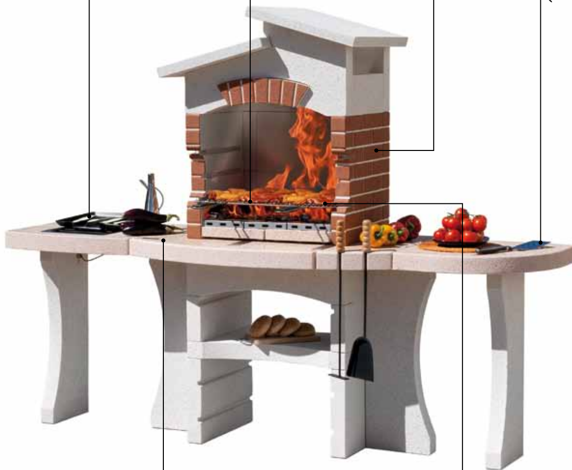
Table de travail avec finition Crystal

Elément table de travail supplémentaire (reversible)